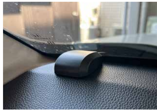
GPS アンテナ ダッシュボードに設置